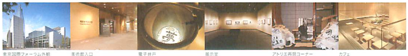
東京国際フォーラム外観 美術館入口 電子井戸 展示室 アトリエ再現コーナー カフェ